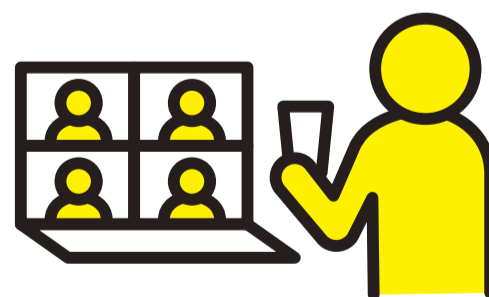
飲み会は オンラインで