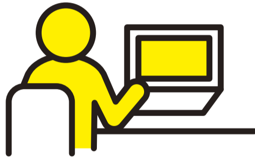
テレワークも活用