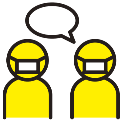
マスクをつけて会話