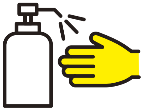
入退室時は 手指を消毒